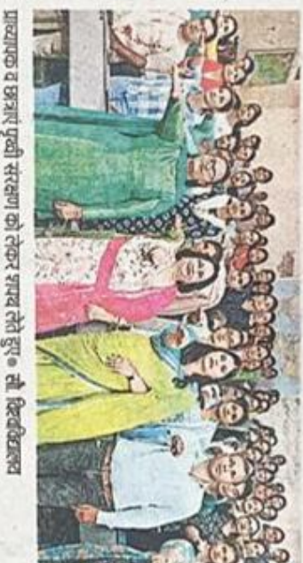
प्राध्यापक व छात्रों पृथ्वी संरक्षण को लेकर शपथ लेते हुए • सी. शिवकिशन