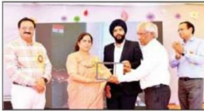
पुरस्कार देते हुए वीपीएस कुलपति।