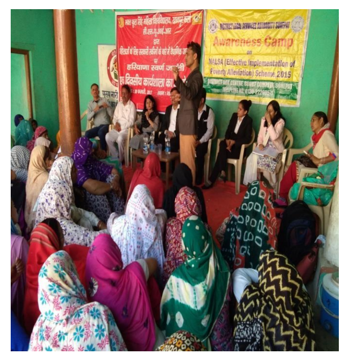
Photographs of Organized One Day Workshop on Legal Information about the Govt. Schemes for the Women