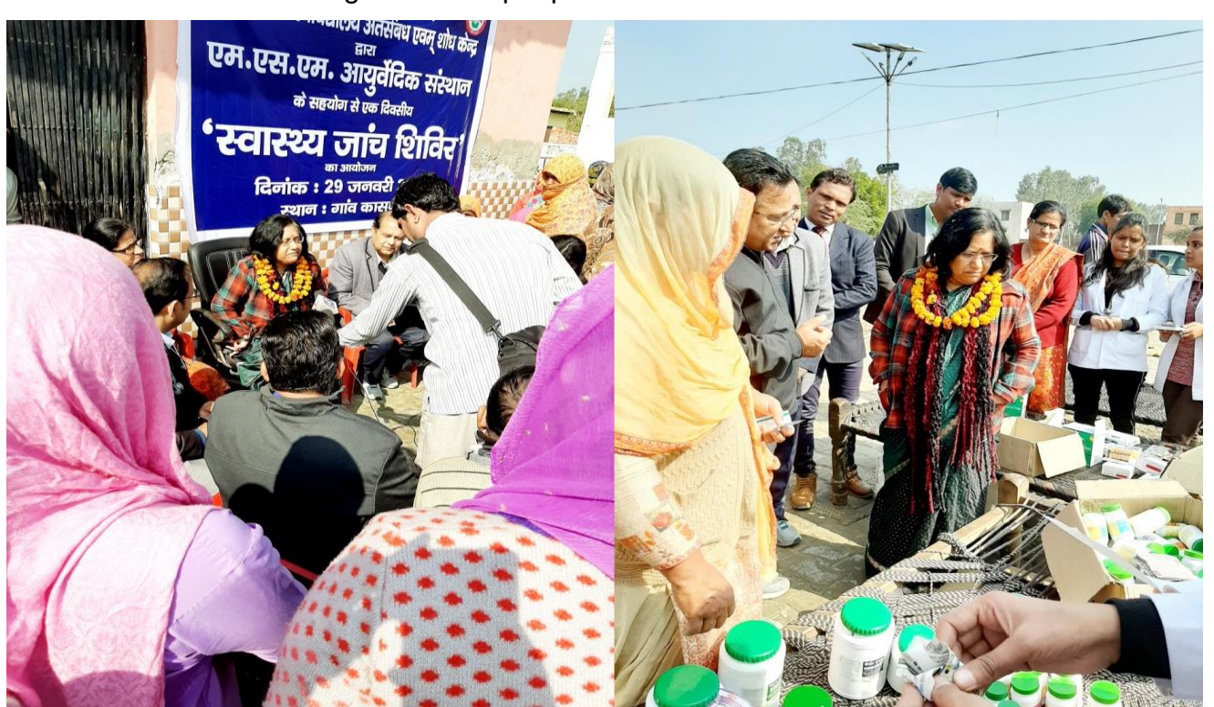
Photographs of Organized Free Health Check-up Camp in Kasanda village in Collaboration with MSM Institute of Ayurveda- January 2020

CSUIR Organized Free Health Check-up Camp in Kasanda village in Collaboration with MSM Institute of Ayurveda- January 2020, in which Prof. Sushma Yadva, Hon'ble Vice Chancellor, BPSMV was invited as Chief Guest. The Doctors and staff from Virmani Diagnostic lab, Gohana was also invited in the camp for various tests. During the Camp, 175 people got health check up and Around 100 people were found less than 9 gram HB level. 10 Girls were found blow 5 gram HB level. These girls were provided medical consultation by the Medical staff of MSM Ayurveda and monitoring and facilitation was done by CSUIR. Free medicines were also given to the people.